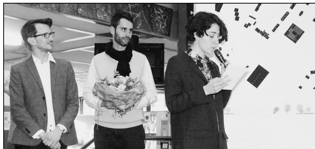
Les lauréats du concours